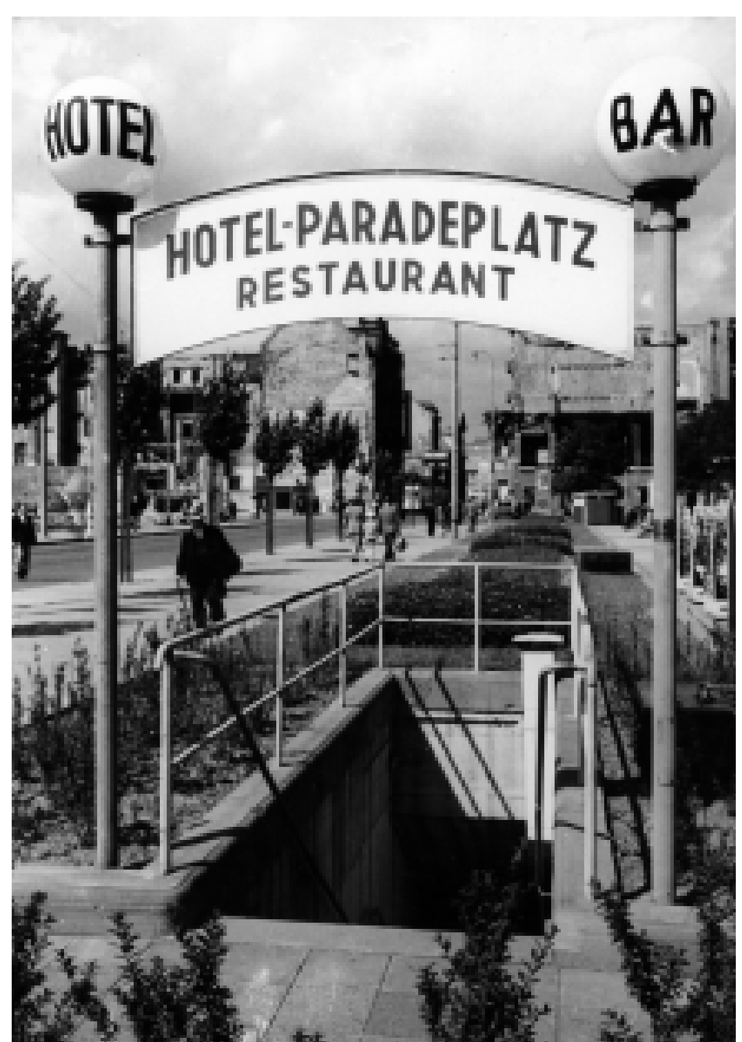
Eingang zum Bunkerhotel Paradeplatz. Das 1947 eröffnete Hotel bietet Betten für 65 Gäste.