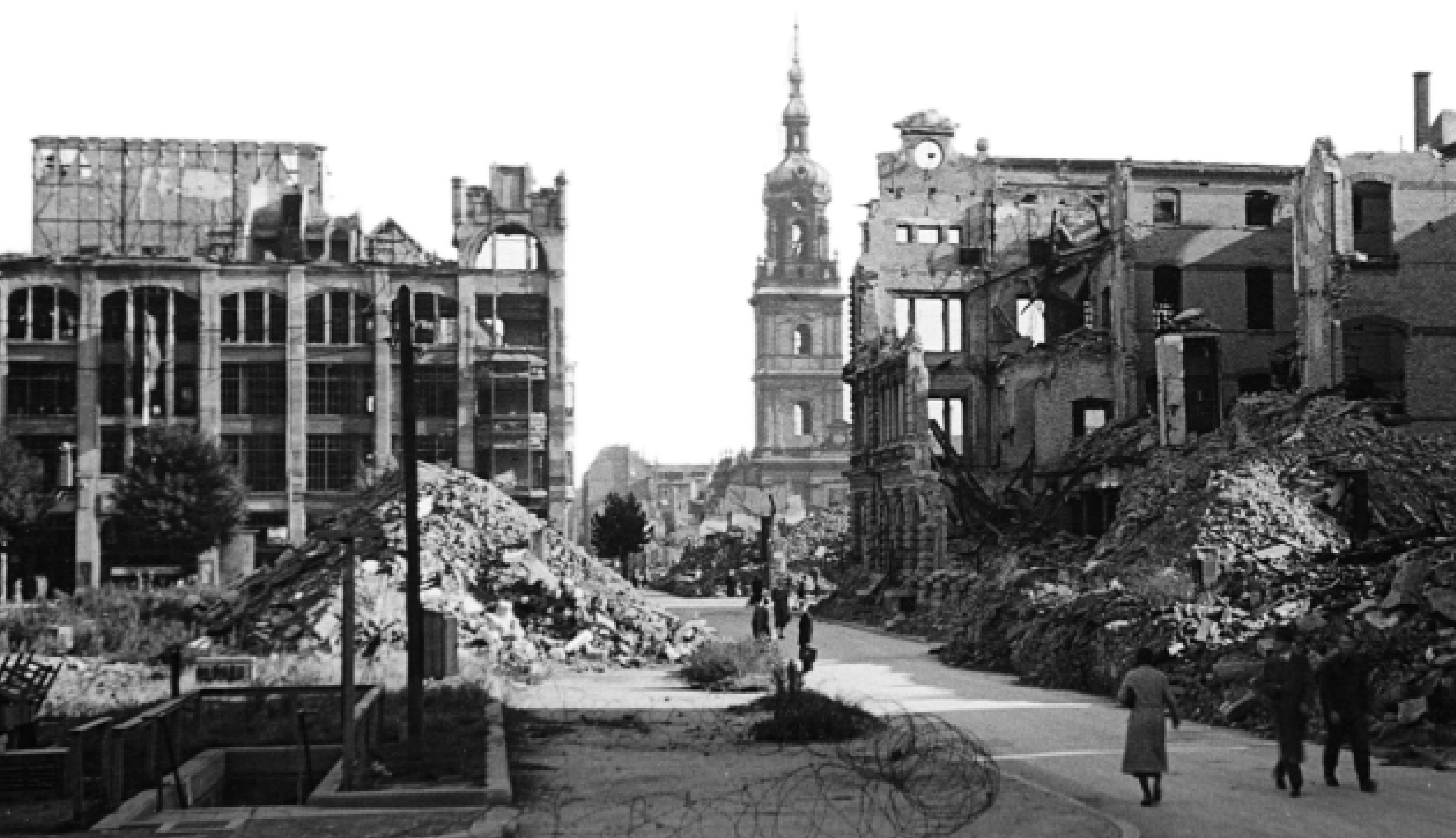
Eingang zum Paradeplatzbunker nach der Zerstörung von 1943. Links das zerstörte Kaufhaus Schmoller, rechts die Ruine der Hauptpost, im Hintergrund die Konkordienkirche.