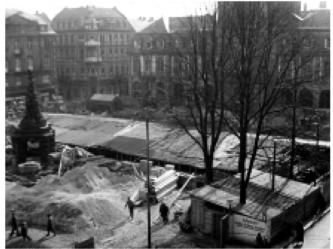
Paradeplatzbunker im Bau, März 1941. Der Bunker wird bereits im Sommer 1941 provisorisch genutzt und im April 1942 offiziell übergeben.

Weiterführende Informationen: www.mannheim.de