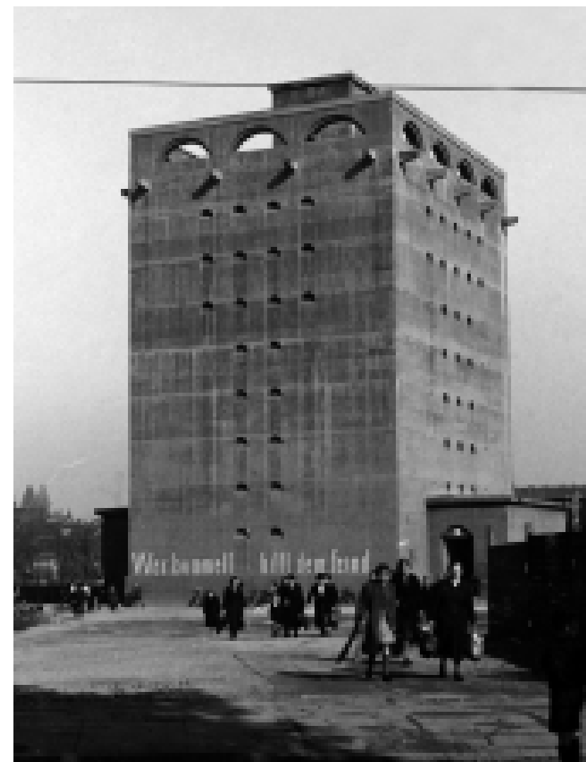
Der Hochbunker am Luisenring bietet im Alarmfall 5 500 Personen Schutz, Foto von 1944.