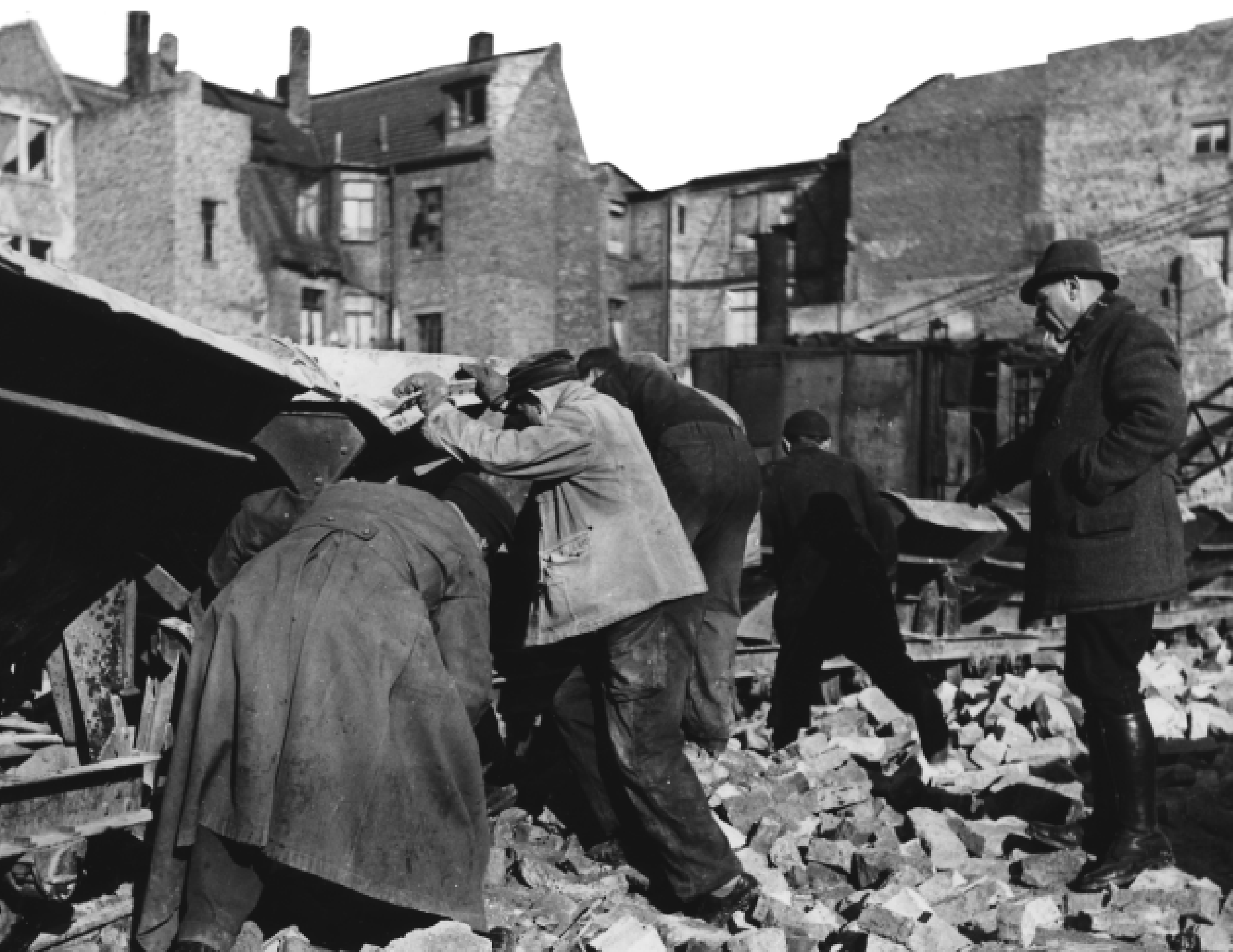
Zur Trümmerbeseitigung verpflichtete Mannheimer beladen die Trümmerbahn, um 1946.

Weiterführende Informationen: www.mannheim.de