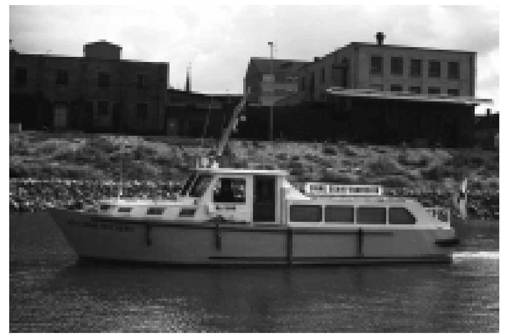
Das Boot „Johann Heinrich Wichern“ der evangelischen Schiffermission, die von der Hafenkirche mit betreut wird, 1970er Jahre.