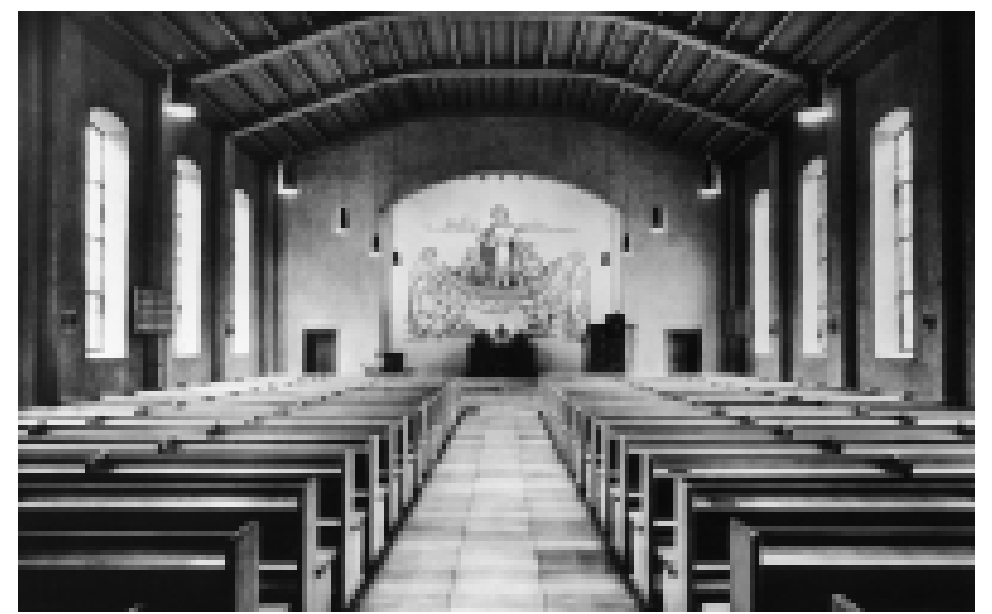
Innenansicht der Hafenkirche mit Blick zum Altar, 1950er Jahre.