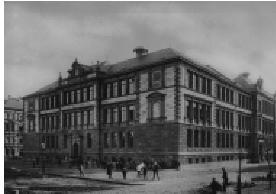
Ansicht der Friedrichsschule vom Friedrichsring aus, um 1892.