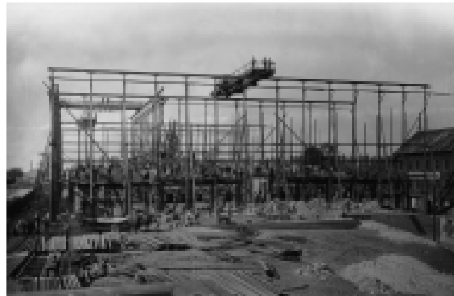
Die Friedrichsschule im Bau mit beeindruckendem Holzgerüst, 1887.