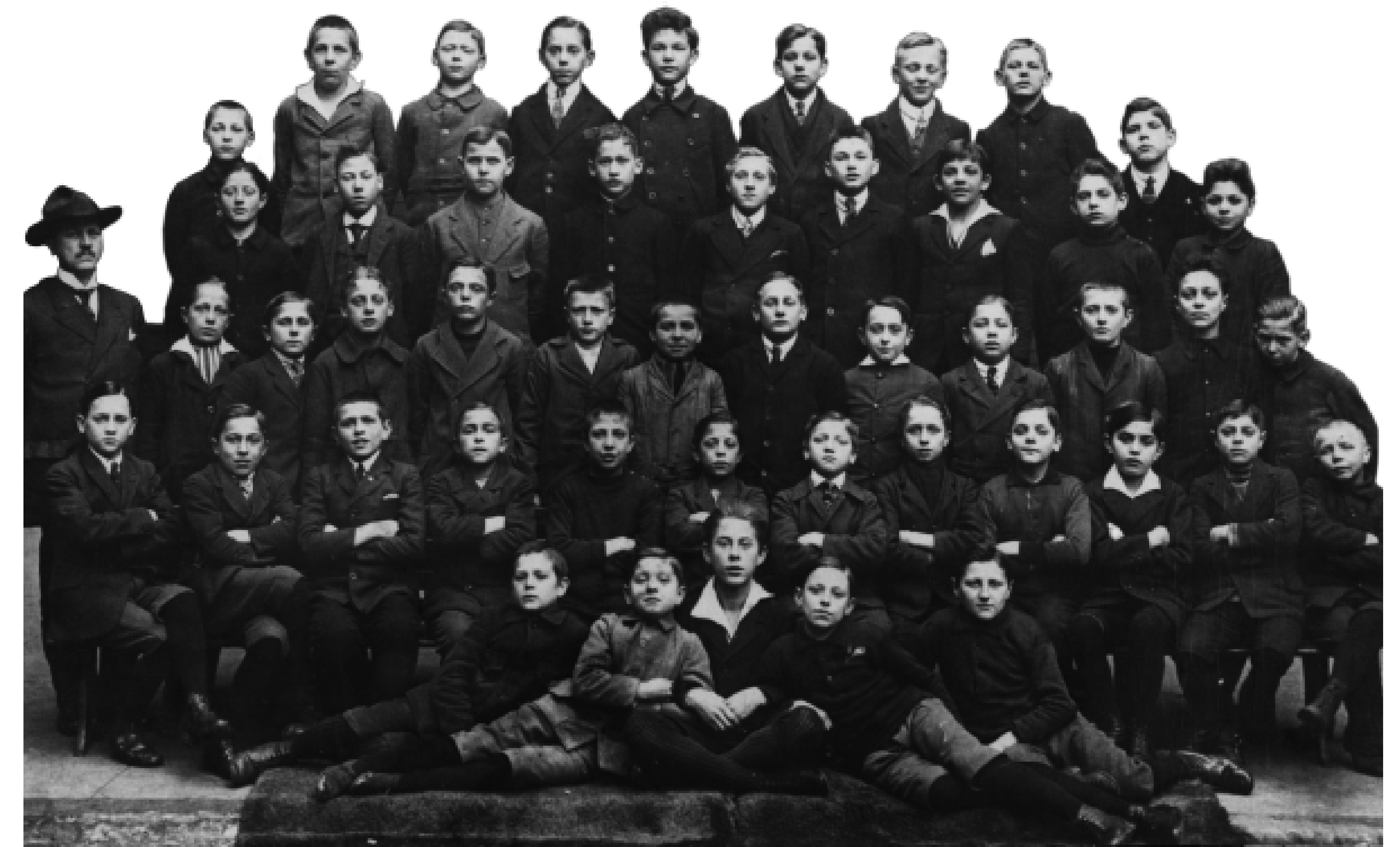
Der Jahrgang 1908 im 8. Schuljahr, fotografiert im Schulhof der Friedrichsschule, um 1922.

Weiterführende Informationen: www.mannheim.de