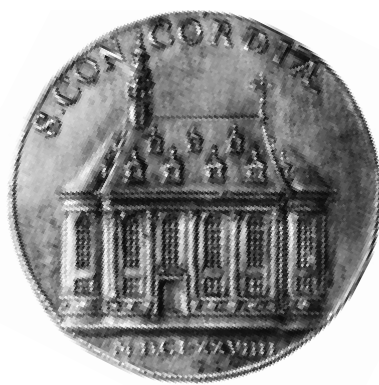
Medaille von 1679 mit Abbild der von Kurfürst Karl Ludwig errichteten Konkordienkirche in der Friedrichsburg.

Weiterführende Informationen: www.mannheim.de