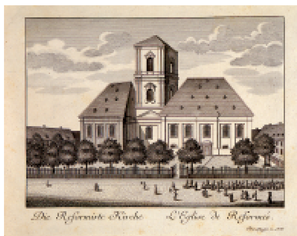
Doppelkirche der reformierten Gemeinden in 18. Jahrhundert. Der Wiederaufbau nach der Stadtzerstörung von 1689 erfolgte in bescheidener Form als im 17. Jahrhundert.