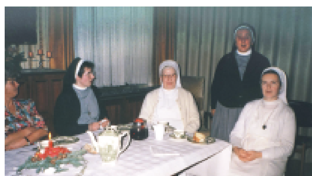
Franziskanerinnen des Klosters Erlenbad in B 5, 19, 1970er Jahre.