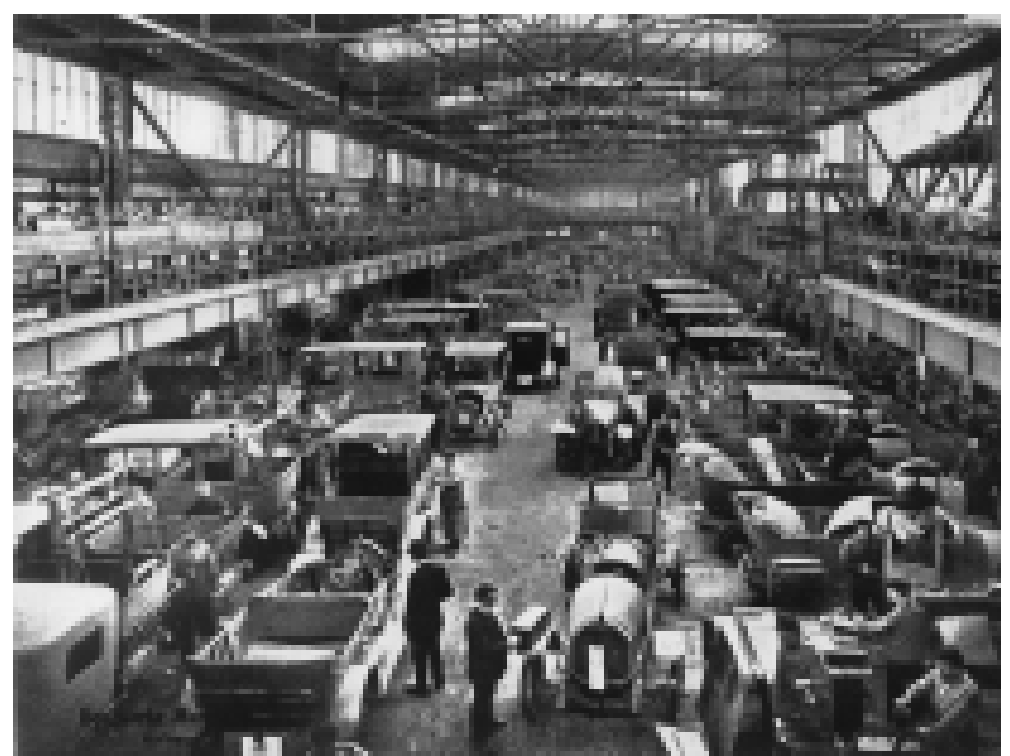
Karosseriemontage in der Benz'schen Motorenfabrik auf dem Waldhof, um 1910.