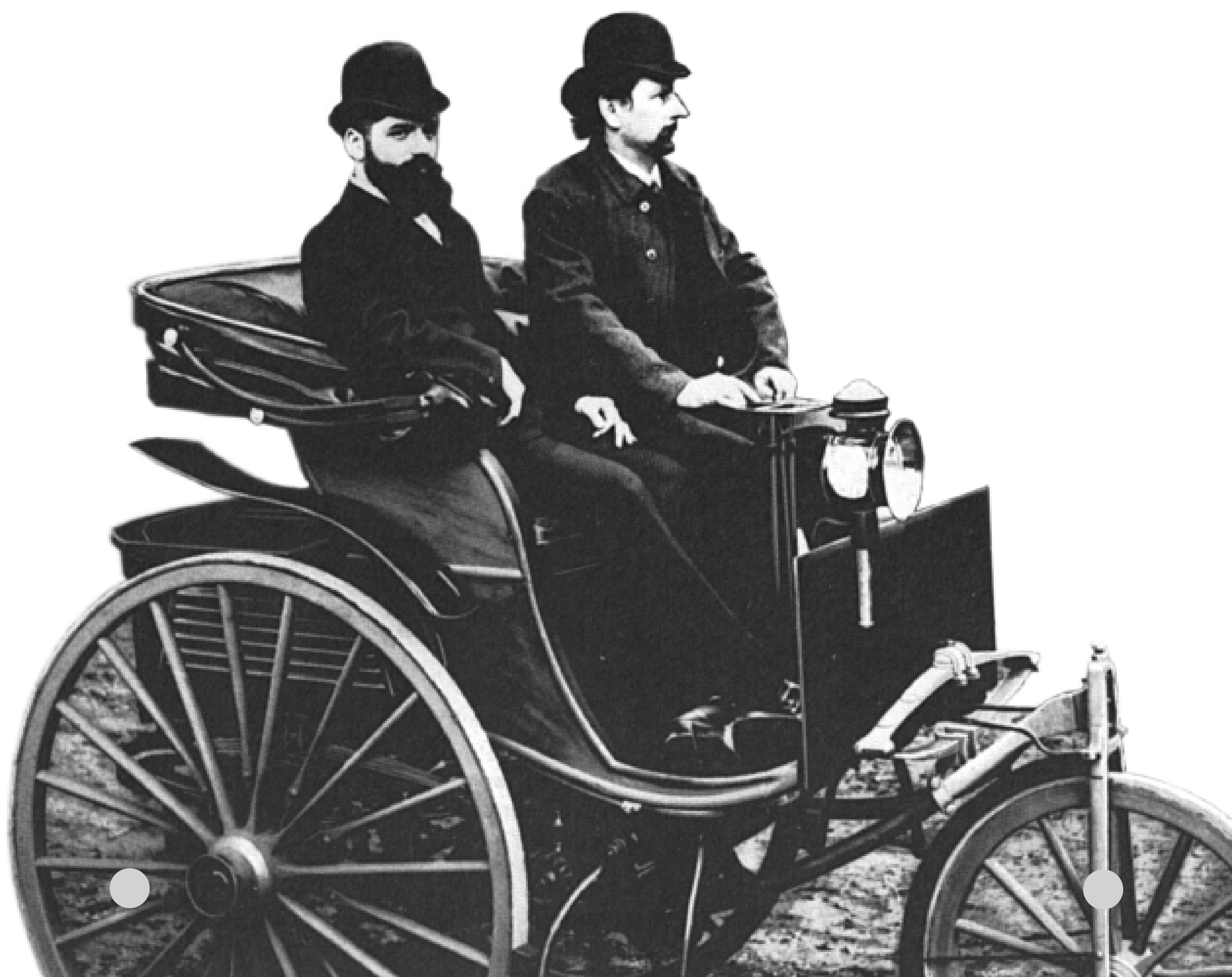
Karl Benz (rechts) in seinem dreirädrigen Motorwagen.