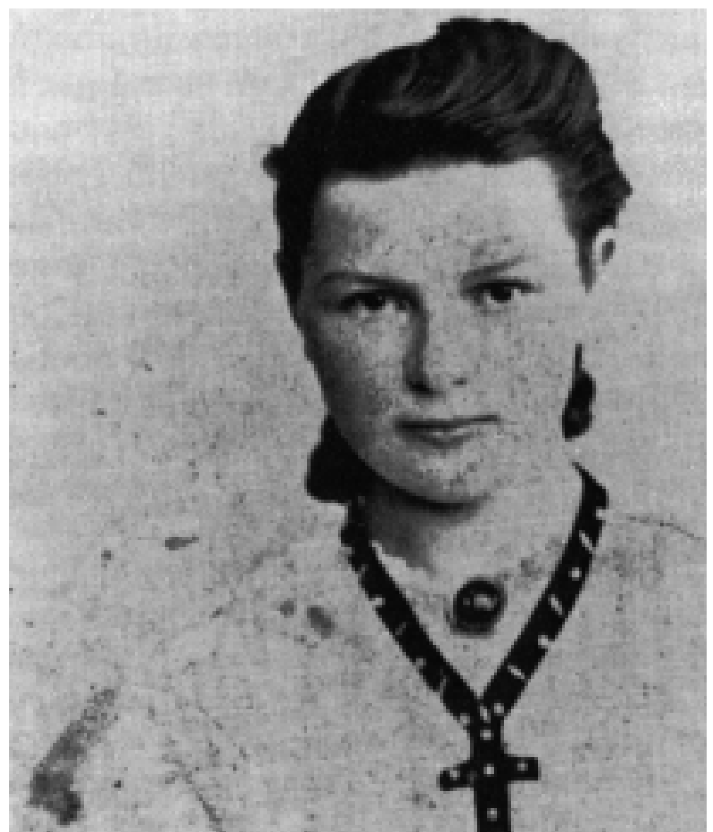
Bertha Benz (1849-1944) in jungen Jahren.