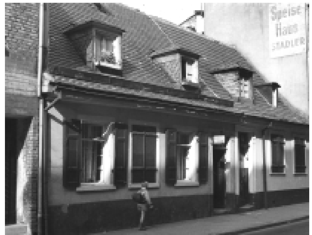
Das Benz-Haus in T 6, 11, um 1935.