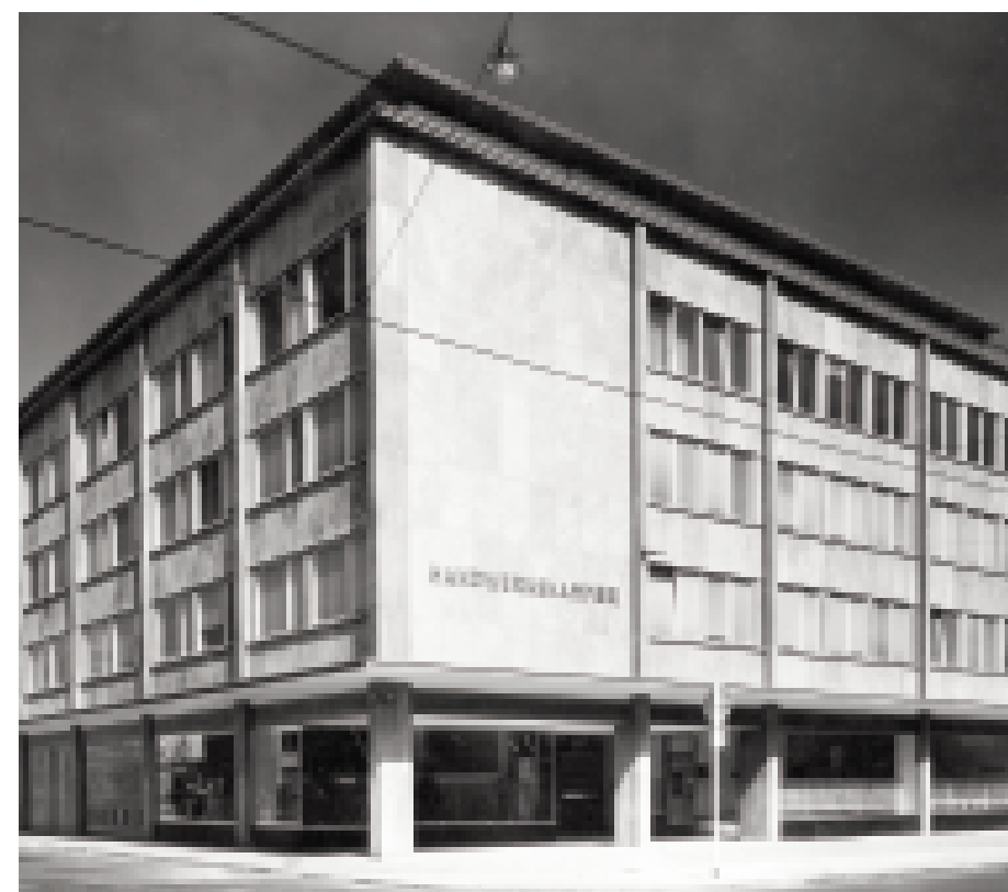
Der Neubau der Handwerkskammer in B 1, 1 im klaren, sachlichen Stil der 1950er Jahre, der geradezu als Prototyp der „Neuen Stadt“ gelten kann, 1958. Das Gebäude wird 1997 saniert und die Fassade neu verkleidet.