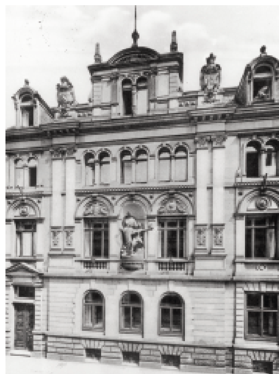
Das repräsentative Gebäude in B 1, 7b, 1904 für die Handelskammer erbaut, wird 1926 von der Handwerkskammer erworben. Es bleibt ihr Sitz bis 1933, als die Handwerkskammer im Zuge der nationalsozialistischen „Gleichschaltung“ zerschlagen wird.

Weiterführende Informationen: www.mannheim.de