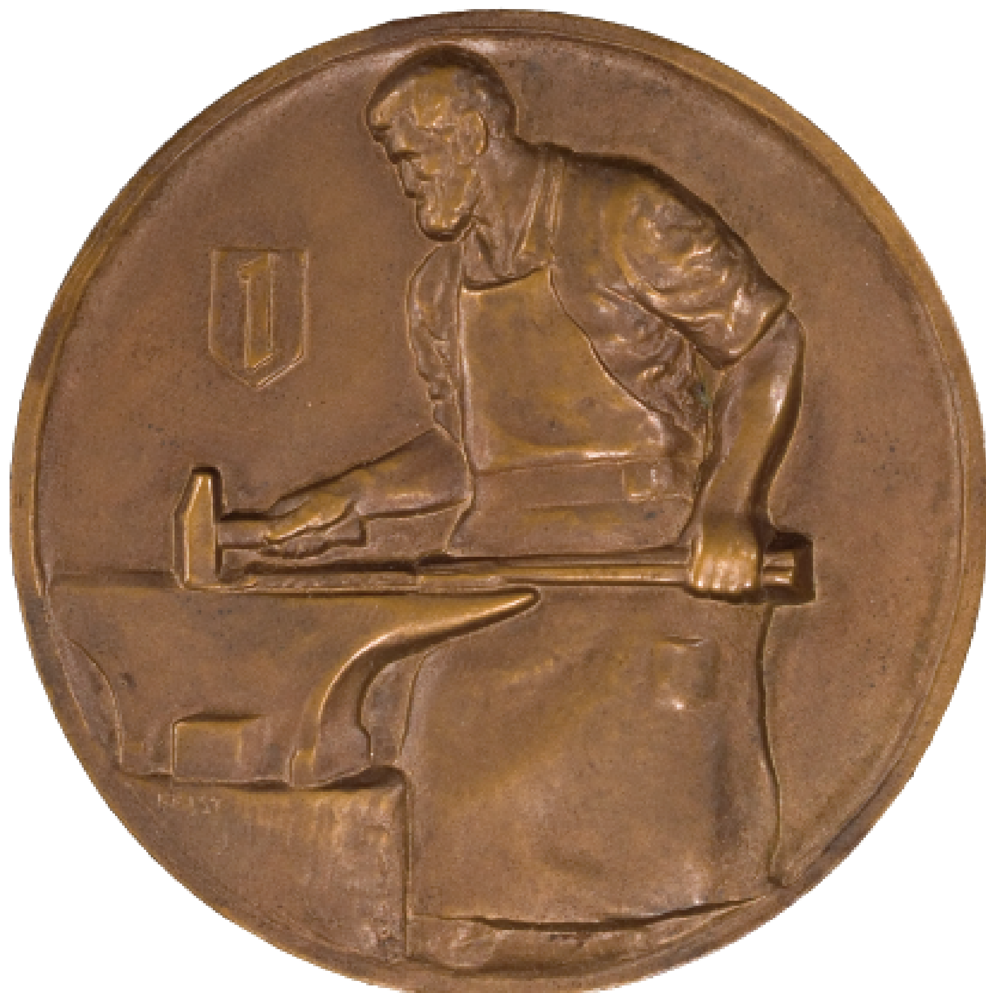
Die Rückseite der Medaille zum 25. Jubiläum der Handwerkskammer von 1926 zeigt einen Schmied am Amboss, im Hintergrund ein Wappenschild mit dem Mannheimer Stadtzeichen der Wolfsangel.