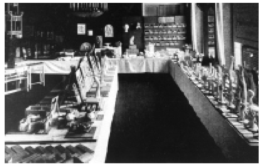
Innenaufnahme im Haus der Harmonie-Gesellschaft anlässlich einer Ausstellung von Arbeiten im 1. Weltkrieg verwundeter Soldaten, 24. Juni 1916.