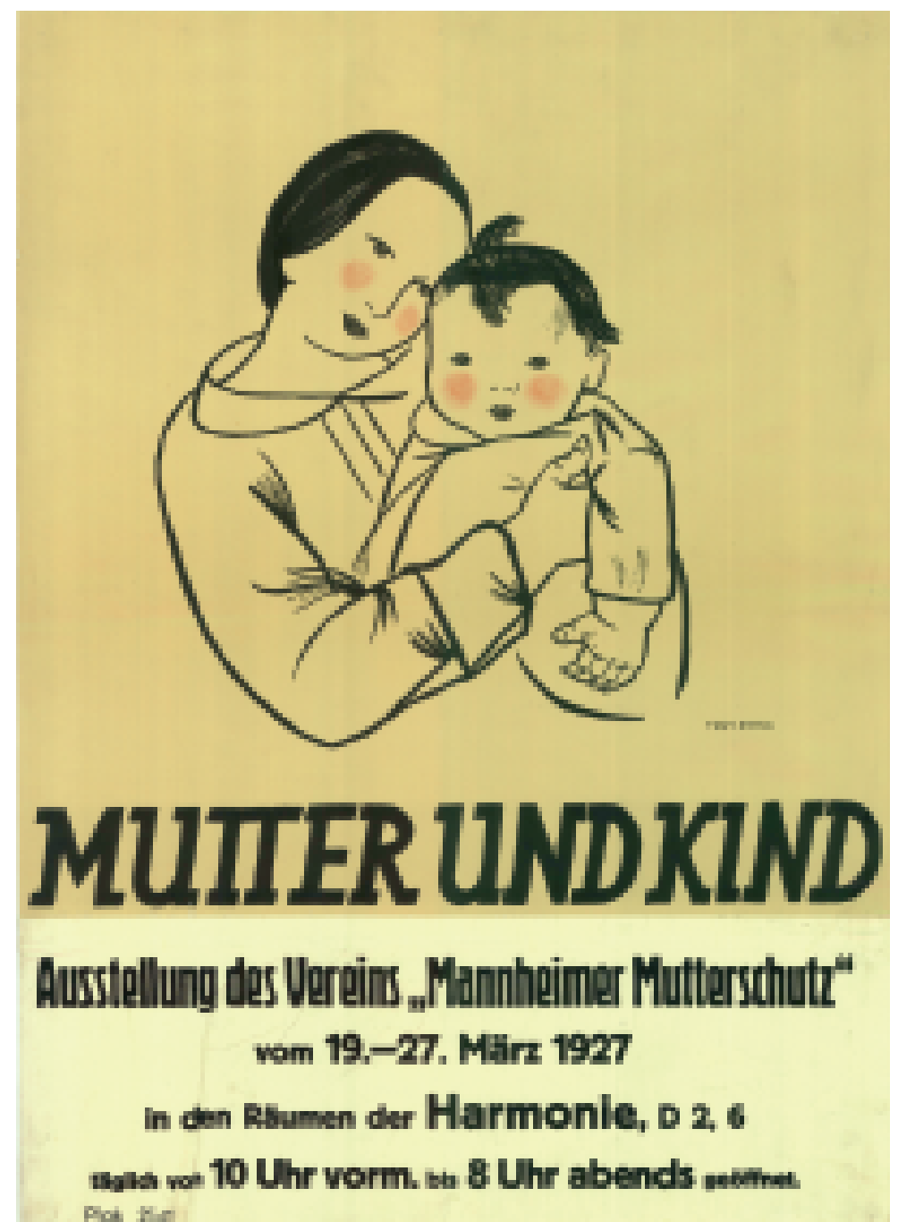
Die Räumlichkeiten der Harmonie-Gesellschaft stehen auch anderen Vereinen und Veranstaltern zur Nutzung offen. So zeigt der Verein „Mannheimer Mutterschutz“ im März 1927 hier eine Ausstellung zum Thema „Mutter und Kind“.