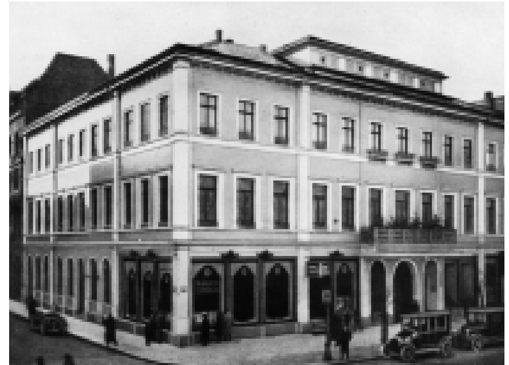
Das Haus der Harmonie-Gesellschaft, um 1920.