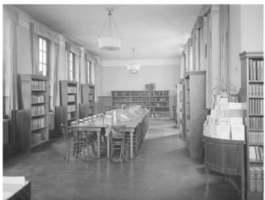
Die Volksbibliothek im Herschelbad, um 1925. Die Räumlichkeiten des Gebäudes werden nicht ausschließlich als Badeanstalt genutzt. So finden hier zeitweise auch das Stadtarchiv oder zuletzt die Freie Akademie der Künste ein Domizil.

Rechts: Ansicht vom benachbarten Quadrat U 2 aus, um 1930.