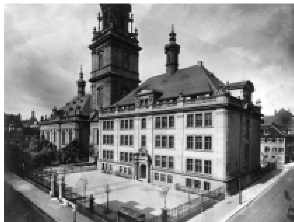
Erst 1914 wird die ursprüngliche Doppelanlage architektonisch wiederhergestellt. In dem an den Barockstil angelehnten Schulgebäude ist heute die Mozartschule beheimatet.