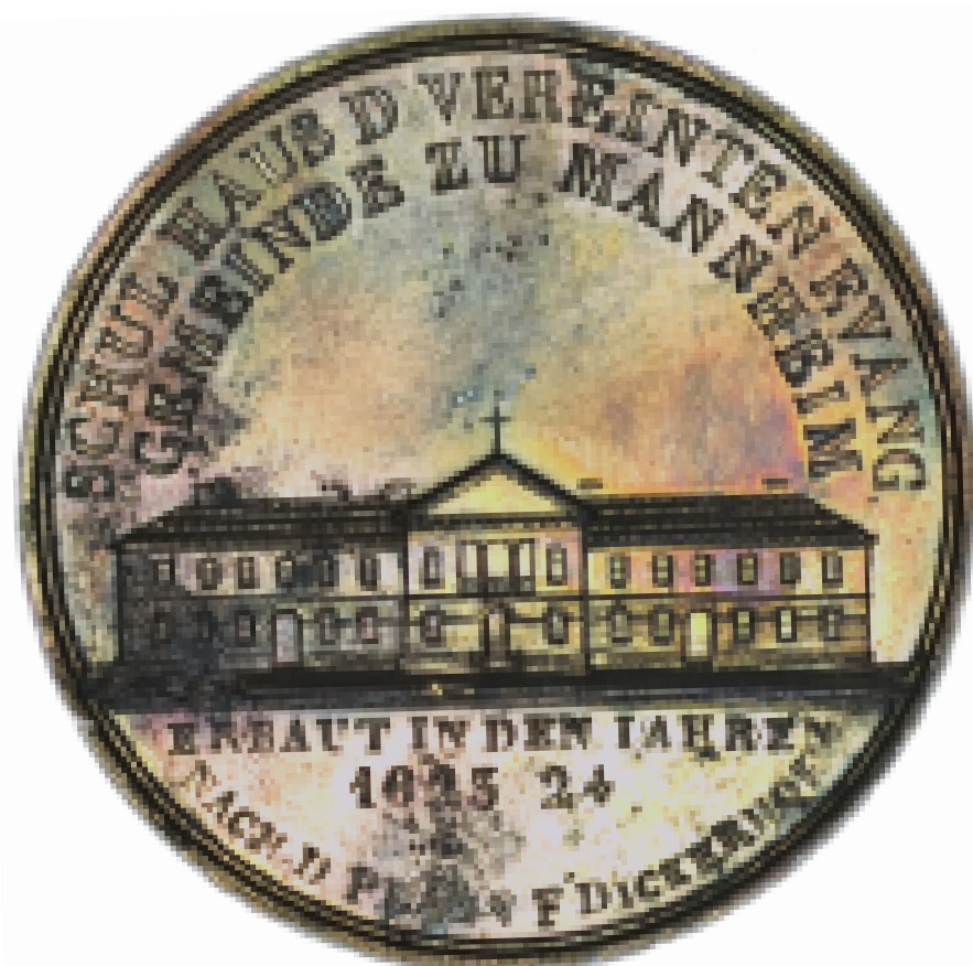
Medaille auf den Bau des Schulhauses der Vereinigten Evangelischen Gemeinde Mannheim, 1823.