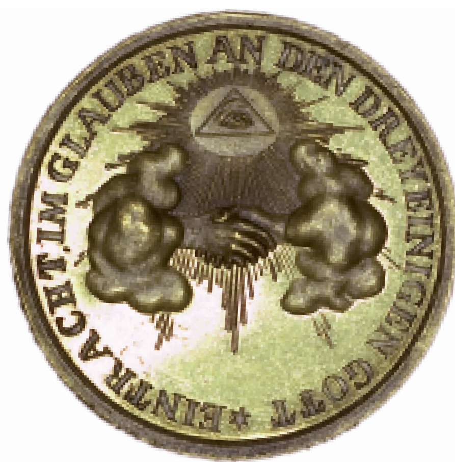
Mannheimer Medaille auf die Kirchenunion von 1821.