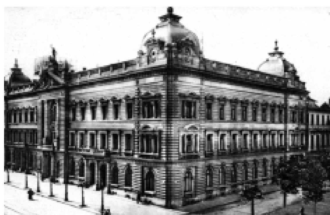
Das bis zum Paradeplatz erweiterte Gebäude der Reichspost, um 1912.