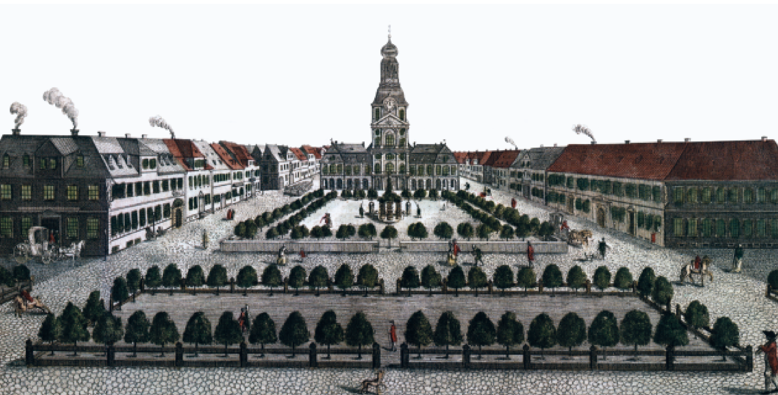
Der Paradeplatz im 18. Jahrhundert: Das Gebäude links, vor dem die Kutsche steht, ist das Postamt.

Weiterführende Informationen: www.mannheim.de