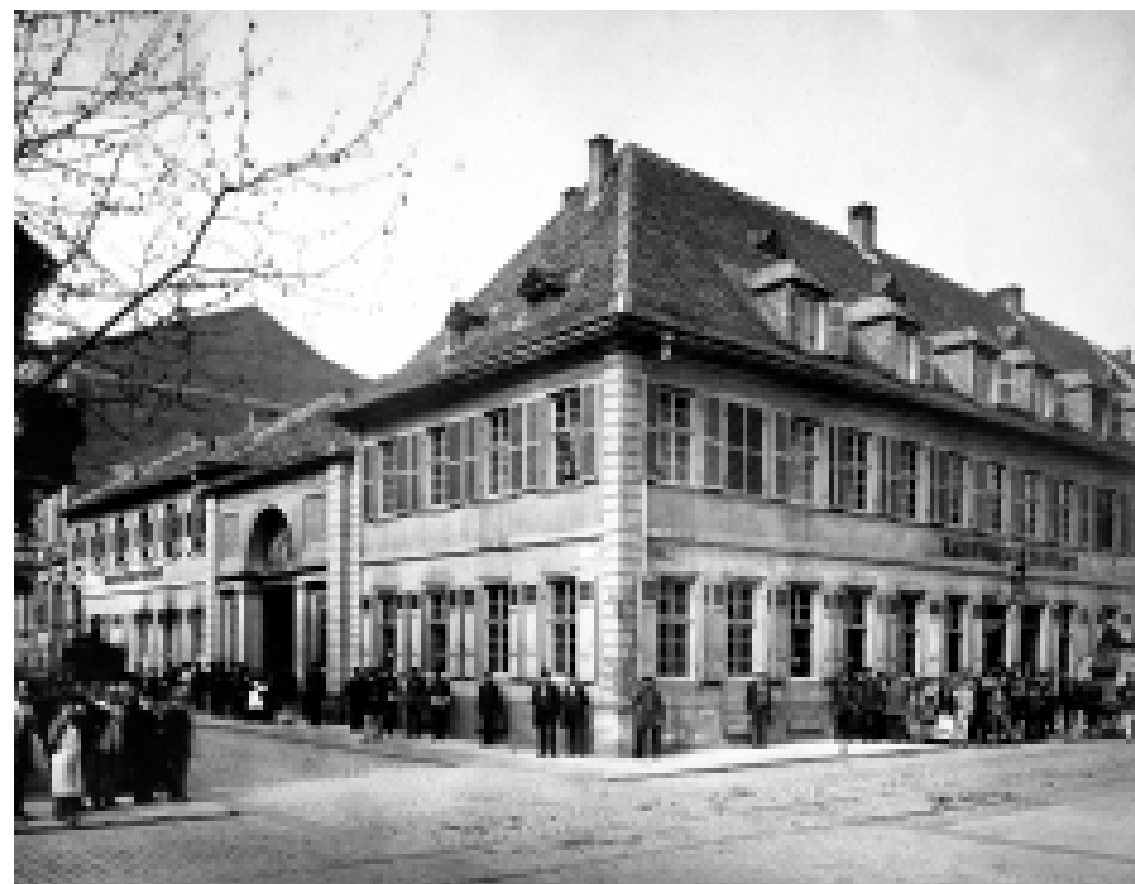
Das Kaiserliche Postamt an den Planken vor dem Abriss 1880.