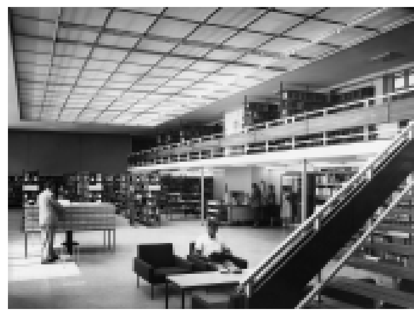
Nach längerer Diskussion entscheidet der Gemeinderat, das Palais als Domizil für die Stadt- und Musikbibliothek zu nutzen. Innenaufnahme, 1961.