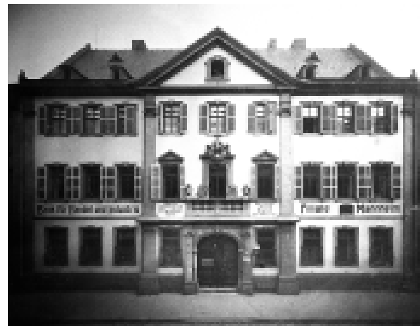
Das Dalberghaus beherbergt zu Beginn des 20. Jahrhunderts eine Filiale der Bank für Handel und Industrie.