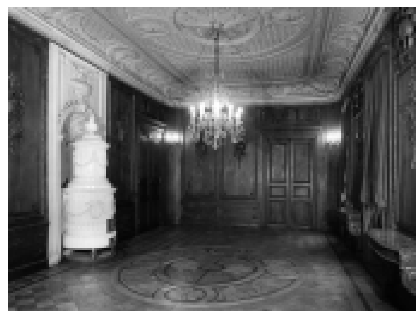
Saal im ersten Obergeschoss vor dem 2. Weltkrieg.