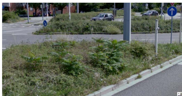
Mindestpflege: Pflege 2x jährlich