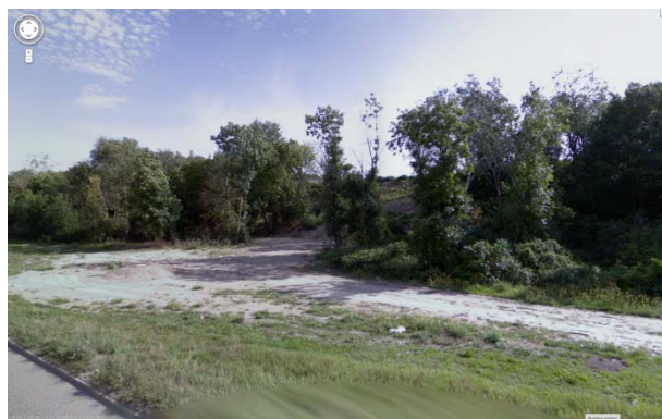
Naturnah: keine Pflege