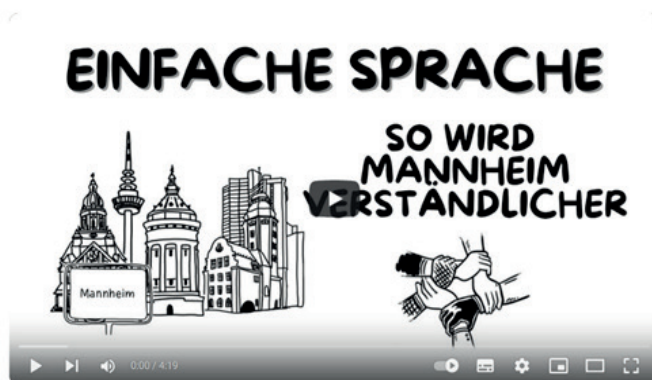
Einfache Sprache – So wird Mannheim verständlicher

Hier finden Sie einen Erklärfilm zum Thema.