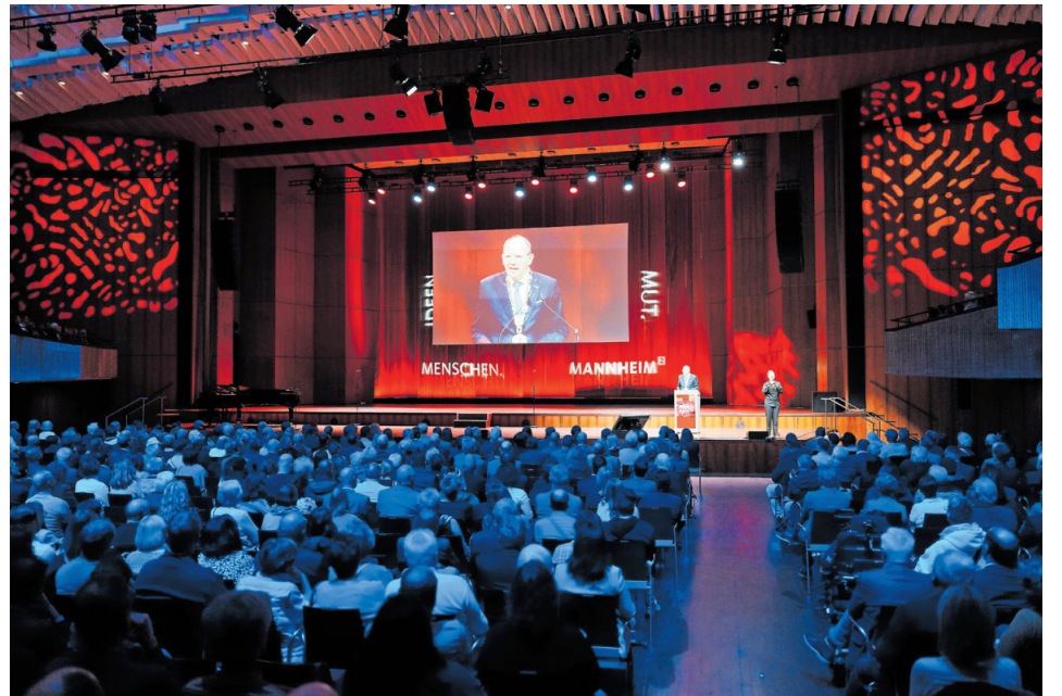
Oberbürgermeister Christian Specht bei seiner Rede im Rahmen des Festakts