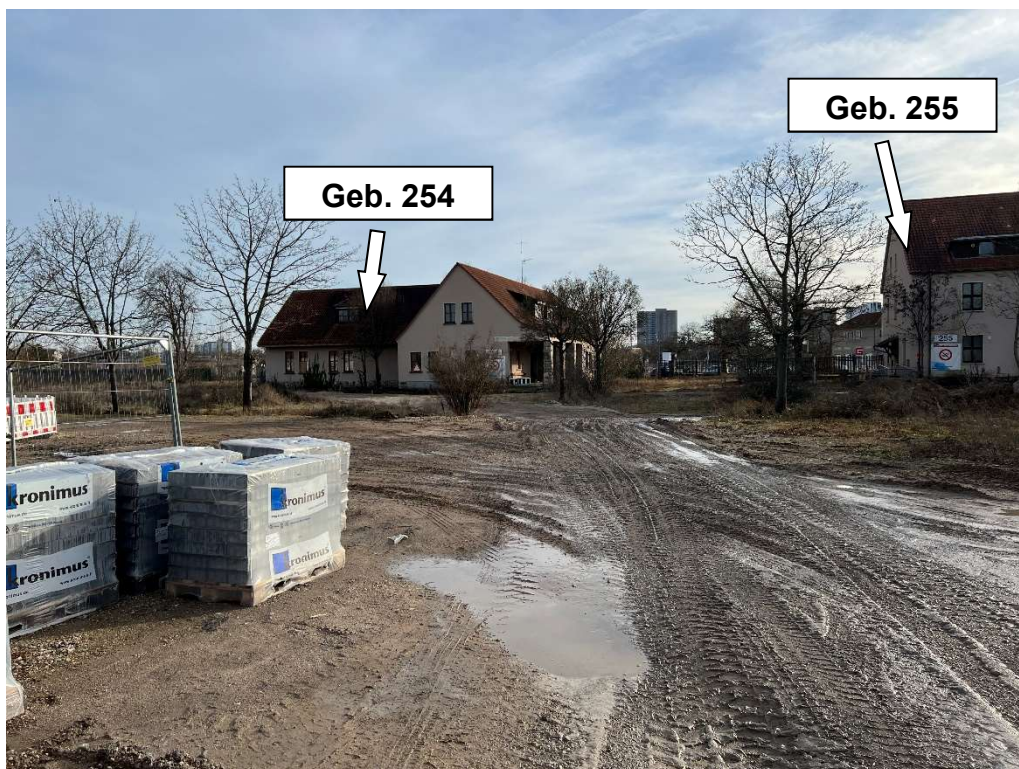
Bild 2 Blick in Richtung Süden, auf Geb. 254 u. 255