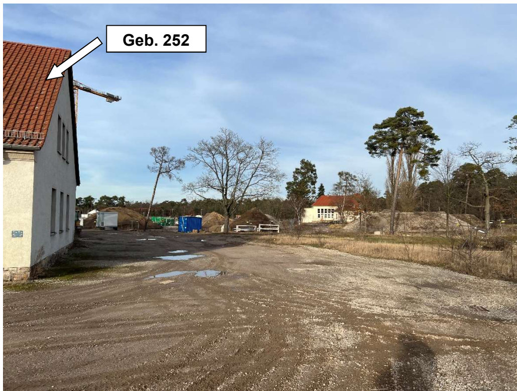
Bild 4 Blick nach Norden am Geb. 252 vorbei