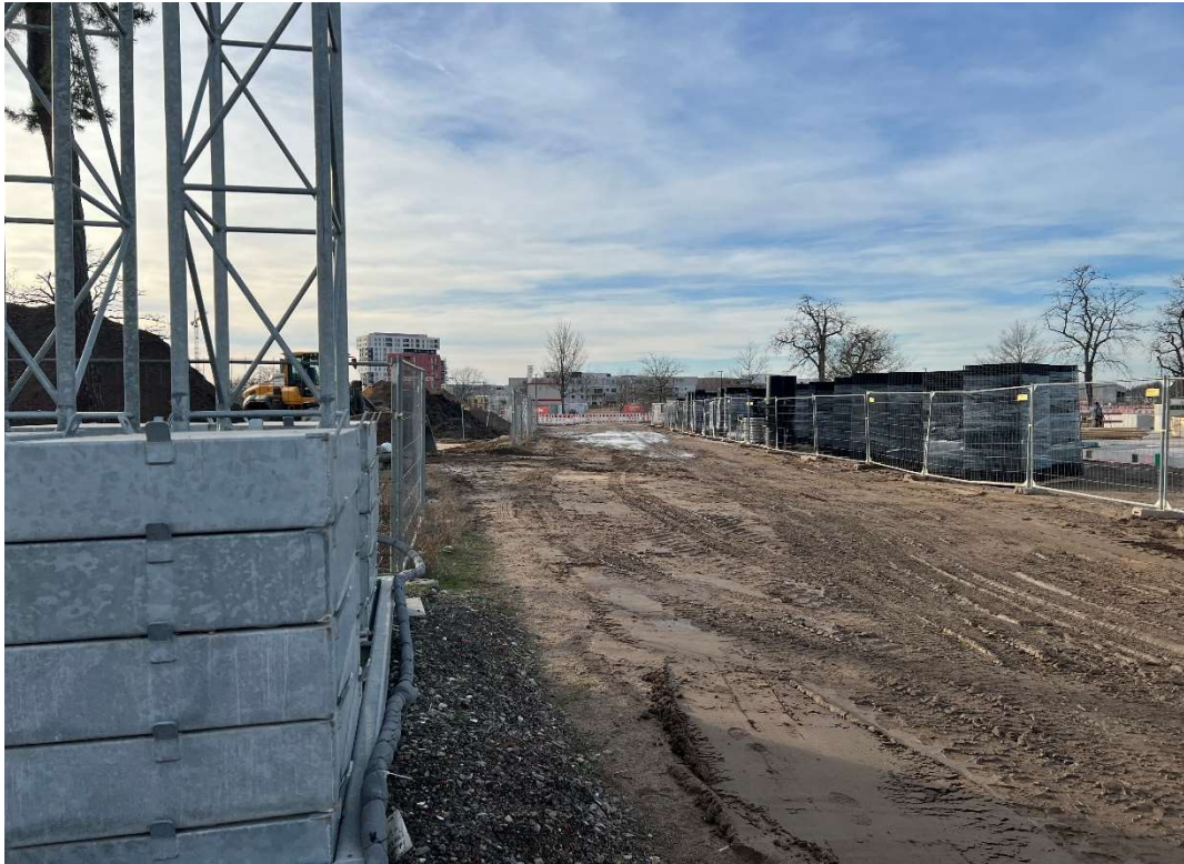
Bild 7 Blick nach Westen entlang zukünftiger Joy-Fleming-Ring, linke Hand Haufwerkbereitstellungsfläche, rechte Hand Baustofflager