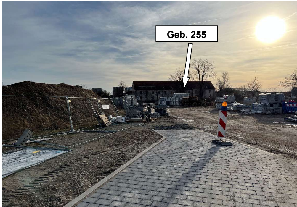
Bild 1 Blick nach Süden, in Richtung Geb. 255, rechte Hand Baustofflager, linke Hand Haufwerkbereitstellung