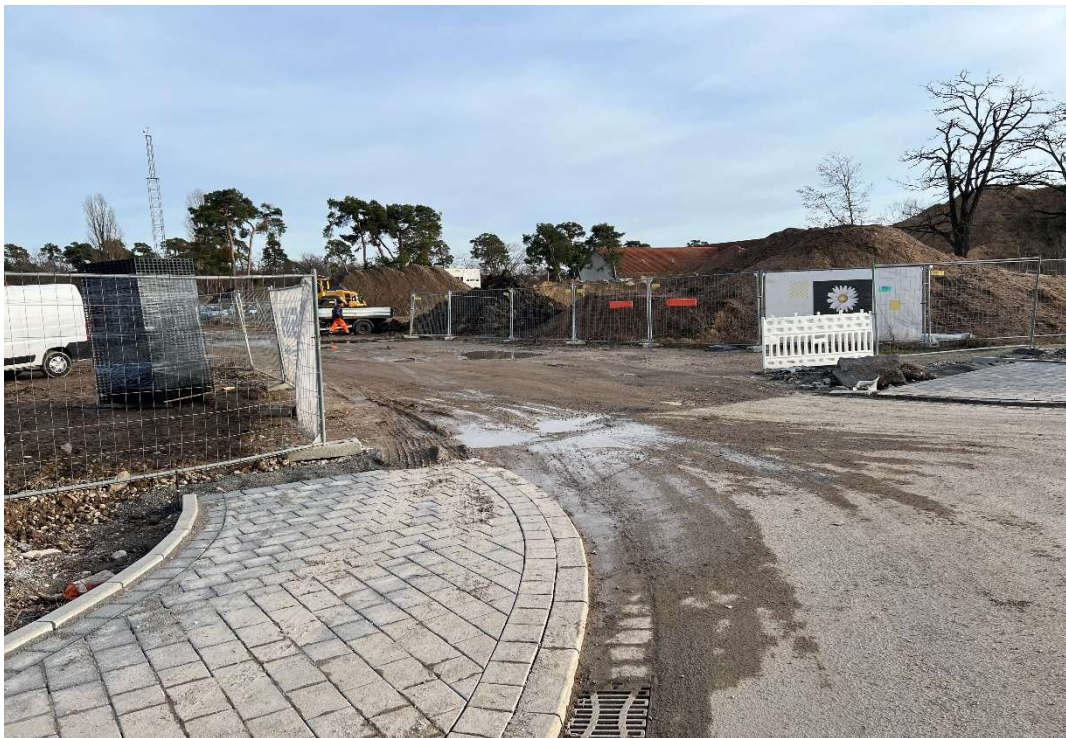
Bild 8 Blick nach Südosten von Ecke George-Sullivan-Ring / Joy-Fleming-Ring auf Haufwerkbereitstellungsfläche