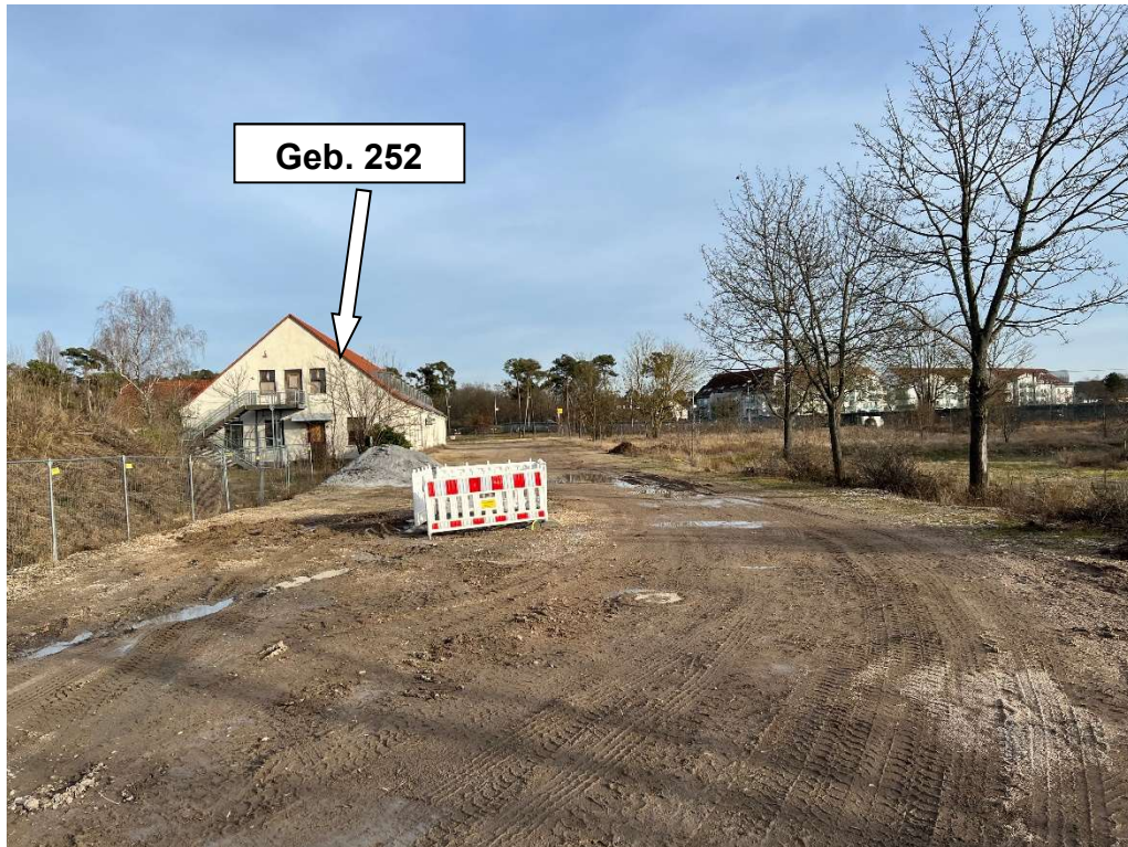
Bild 3 Blick in östliche Richtung auf Geb. 252, linke Hand Haufwerkbereitstellung, rechte Hand Grünflächen nach Entsiegelung