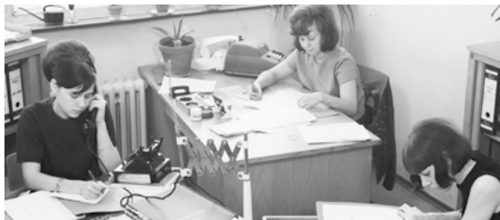
Foto: Frauen im Büro vom Kaufhaus Herti, 1965

Mi., 29. Okt. 2025 | 18:00 – 21:00 Uhr kostenlos