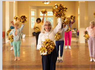
Foto: © STX Entertainment / Poms (Diane Keaton in „Dancing Queens“)

Herzliche Einladung an alle, die Lust auf einen abwechslungsreichen Abend haben.