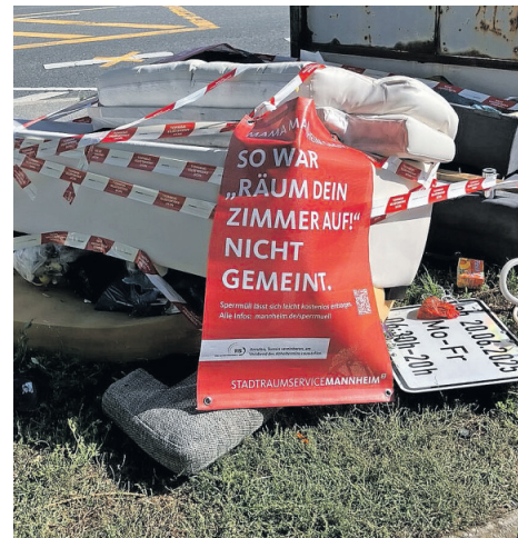
Mit Bannern und Klebeband markierte Wilde Müllablagerung.

Um zu zeigen, dass ein Fehlverhalten vorliegt und um zu sensibilisieren, wie Sperrmüll richtig entsorgt wird, kennzeichnet der Stadtraumservice in den kommenden Monaten an bekannten Hotspots Wilde Ablagerungen mit Hinweisbannern sowie einem auffälligen Klebeband mit der Aufschrift „Nicht angemeldeter Sperrmüll“. Die Banner tragen die Aufschrift „Mama/Papa Mannheim sagt: So war ‚räum dein Zimmer auf!‘ nicht gemeint!“. Ein Hinweis auf die Behördennummer 115 sowie ein QR-Code zum Sperrmüll-Online-Formular, erklären mit einem Augenzwinkern, wie Sperrmüll richtig entsorgt wird.