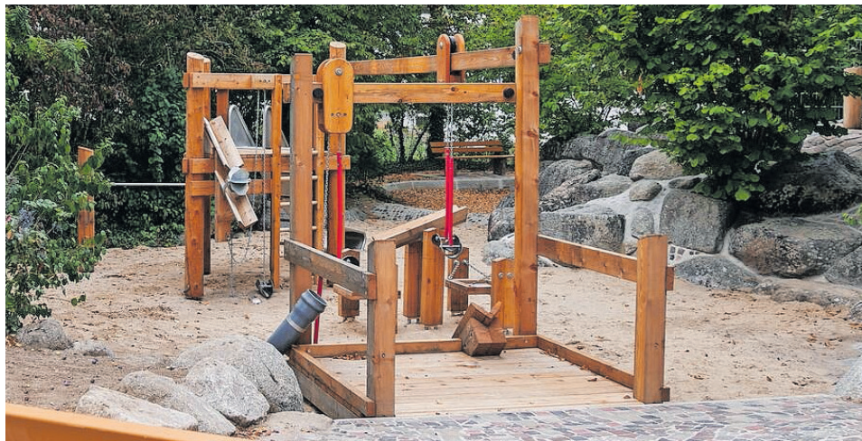
Der neugestaltete Spielplatz in der Ihringer Straße.