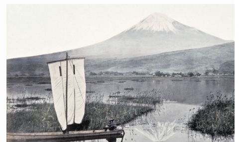
Der rem-Blog entführt unter anderem zum Fuji nach Japan.

im 18. Jahrhundert am liebsten ihre Sommerfrische verbracht haben. Sie begleiten die ersten Touristinnen und Touristen im 19. Jahrhundert auf ihre teils abenteuerlichen Reisen, besteigen die Pyramiden oder gehen mit mächtigen Ozeandampfern auf große Fahrt. Ein Beitrag entführt ans Meer. Um 1900 erlebten Küstenorte einen regelrechten Boom. Hier entstanden auch die im Impressionismus so beliebten Gemälde mit Strandansichten. Einige Beispiele dafür sind ab 21. September in der Sonderausstellung „AUFGETAUCHT! Philipp Klein im Kreis der Impressionisten“ zu bewundern.