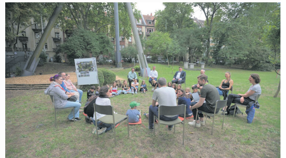
Kinderchor engagiert sich für biologische Vielfalt – Bau von Nisthilfen im Kirchengarten

Neben der handwerklichen Aktivität stand auch die Beteiligung an der Biodiversitätsstrategie selbst auf dem Programm: In einer