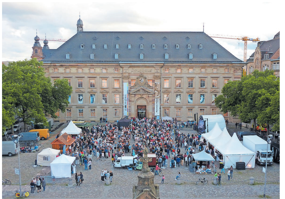
Toulonplatz vor dem Museum Zeughaus