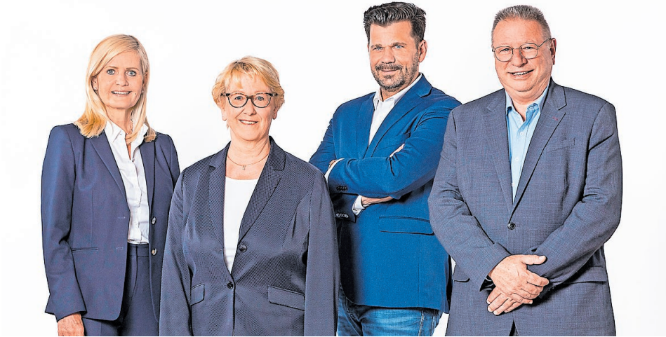
FDP / MfM-Fraktion