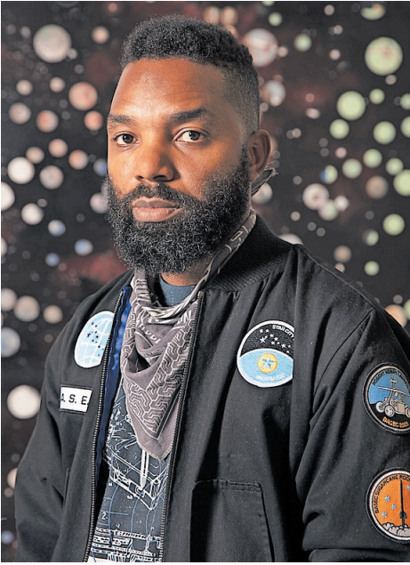
Tavares Strachan.

Die Kunsthalle zeigt vom 11. April bis 24. August die erste große Überblicksschau des in New York lebenden bahamaischen Künstlers Tavares Strachan in Kontinentaleuropa und schafft hiermit die Möglichkeit, das Werk des international gefeierten Künstlers erstmals in Deutschland zu erleben. Ob Tavares Strachan (geb. 1979 in Nassau, Bahamas) Expeditionen in die Arktis unternimmt und einen 4,5 Tonnen schweren Eisblock an seinen Geburtsort auf den Bahamas zurückschickt, ein Kosmonautentraining absolviert, einen goldenen Kanopenkrug mit dem Konterfei des ersten Schwarzen Astronauten in den Orbit schickt oder seine eigene Alternative zur Encyclopædia Britannica kreiert – seine kühnen, poetisch-konzeptuellen Werke sind durch eine visuelle Spurens des Geschichtenerzählens strukturiert. Nun präsentiert die Kunsthalle Mannheim die erste große Überblicksausstellung des international gefeierten Künstlers in Kontinentaleuropa. Strachan, der seine künstlerische Arbeit als „unendlichen Protest gegen den Status quo“ beschreibt, bewegt sich an den Schnittstellen von Kunst, Wissenschaft und Geschichte. Ae-