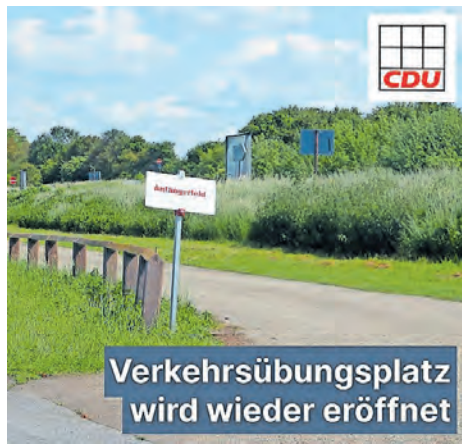
Verkehrsübungsplatz wird wieder eröffnet

„Wir freuen uns für alle Fahranfänger, dass der Verkehrsübungsplatz auf dem bisherigen Gelände an der Autobahn erhalten bleibt. Dafür bedanken wir uns ausdrücklich beim Geschäftsführer der Mannheimer Parkhausbetriebe GmbH (MPB), Carsten Südmersen. Er und seine Mitarbeiter haben ermöglicht, dass die E-Ladestationen und die geplanten Photovoltaikanlagen so angeordnet werden, dass der Betrieb des Verkehrsübungsplatzes ohne Einschränkung möglich ist. Es ist gut, dass Südmersen wichtige Einrichtungen zum Klimaschutz und zur Energiewende und die Anforderungen des Verkehrsübungsplatzes unter einen Hut gebracht hat“, erklärt der CDU-Fraktionsvorsitzende Claudius Kranz.