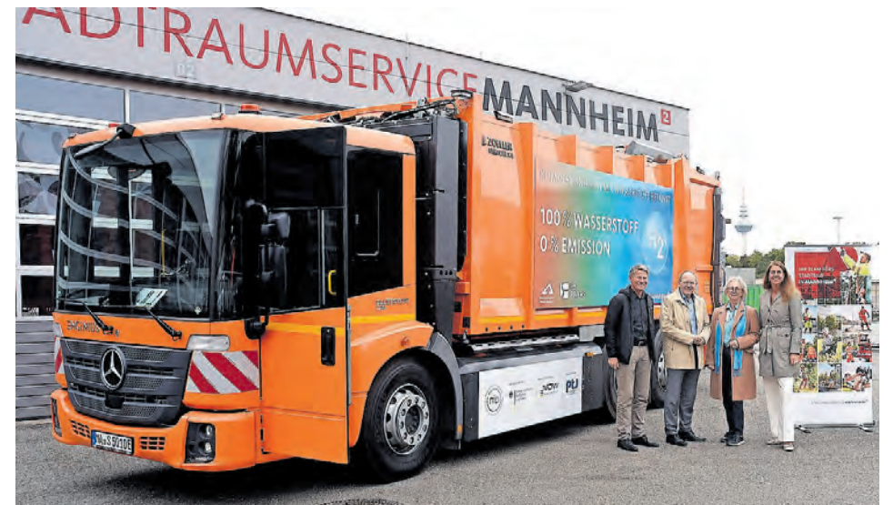
Das Wasserstofffahrzeug des Stadtraumservices wurde eingeweiht

stunden. Sinkt diese unter 75 Prozent, schaltet sich die Brennstoffzelle automatisch zu, wandelt den Wasserstoff in den erforderlichen Strom um und versorgt die Batterie mit Energie. Dadurch wird die Reichweite vergrößert.