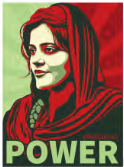
Jina Mahsa Amini

Die GRÜNE Gemeinderatsfraktion fordert in einem Antrag die Benennung eines Jina-Mahsa-Amini-Platzes in Mannheim. Darin wird die Verwaltung aufgefordert, einen geeigneten, zentralen und markanten Ort vorzuschlagen, der in „Jina-Mahsa-Amini-Platz“ umbenannt werden soll.