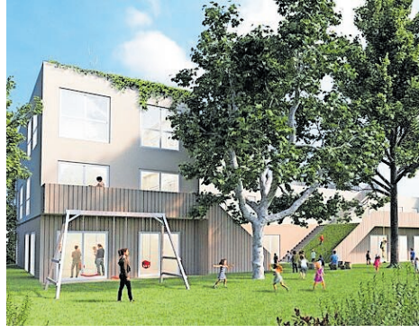
Visualisierungen des Kinderneests Schneeberg