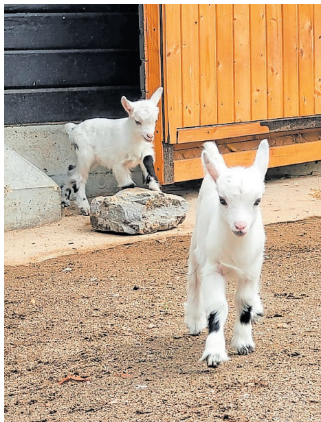
BUGA-23-Babys bei den Ziegen