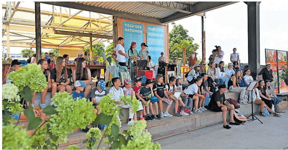
Kinder haben Stühle für den Tisch der Nationen gestaltet