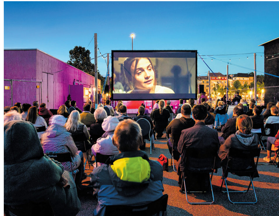
Kinokult Open Air

Das Programm widmet sich in diesem Jahr ganz dem Thema „Enge Bande“. „Nach der Isolation durch die Coronazeit wollten wir nun den Blick auf bewegende Kino- und Kurzfilme lenken, die menschliche Bezie-