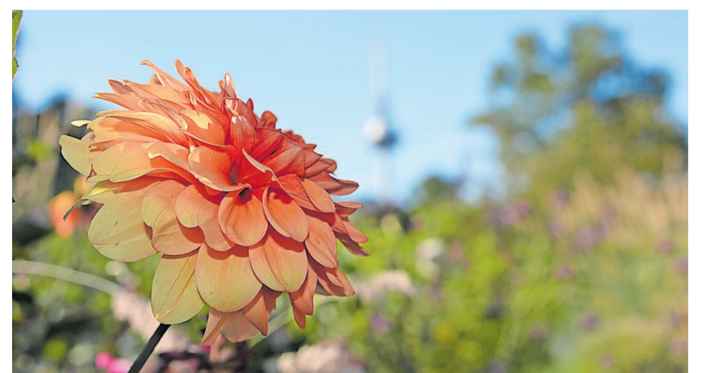
BUGA 23: Dahlien im Luisenpark

Das Dahlieneck im Spinelli-Park (Nr. 56 im Geländeplan) liegt nicht zufällig im Themenfeld Nahrung: Die Knolle der nach dem schwedischen Botaniker Carl Andreas Dahl benannten Blume ist nämlich tatsächlich