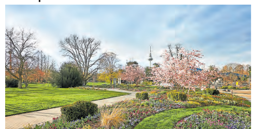
Blütenmeer im Luisenpark