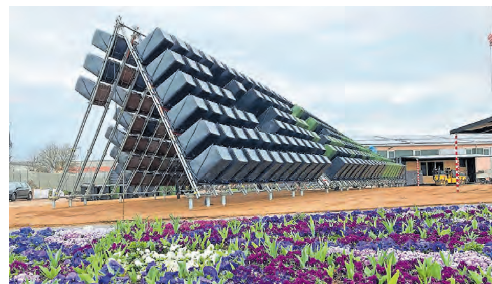
Ausstellungspavillon "Kreislaufwirtschaft" auf der BUGA 23

Eine nachhaltige und ressourcenschonende Kreislaufwirtschaft ist eine zentrale Mission für die Stadt Mannheim. Auf der BUGA 23 sollen die Möglichkeiten aufgezeigt werden, wie sich jede und jeder Einzelne für den Klimaschutz stark machen und sinnvoll einbringen kann. In Zusammenarbeit mit der Ausstellungsagentur musealis aus Weimar hat der Stadtraumservice Mannheim in der Ausstellung einen ermutigenden Zugang gewählt. Wissenschaftsjournalist und Modera-