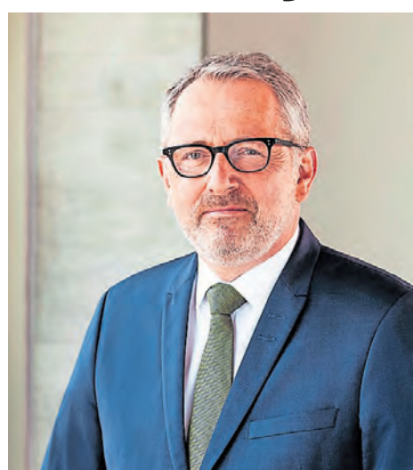
Oberbürgermeister Dr. Peter Kurz

Die Bundesgartenschau ist eine einmalige Chance für die Stadtentwicklung in Mannheim. Mithilfe der BUGA war es möglich, das ehemalige Militärgelände Spinelli zum Bestandteil eines 220 Hektar großen Grünzugs zu verwandeln. Der Grünzug verbessert nicht nur das Stadtklima und erhöht die Lebensqualität in Mannheim. Spinelli wird dauerhaft als freier Naturraum erhalten. Und für mehr Natur inmitten der Stadt sorgen die mit der BUGA verbundenen Projekte der Neckar-Renaturierung und der jetzt schon sichtbaren Wiederherstellung des alten Wasserlaufs durch die Au. Mit den neuen Radwegeverbindungen entsteht ein durchgehend erlebbarer grüner Erlebnisraum von der Innenstadt bis zum Käfertal Wald. Zugleich entsteht mit der BUGA ein neues Stadtquartier mit neuen Konzepten für ein sozial und ökologisch nachhaltiges Wohnen, das Käfertal-Süd erweitert. Und nicht zuletzt konnte durch die BUGA der Luisenpark noch attraktiver gemacht werden. So bleibt er