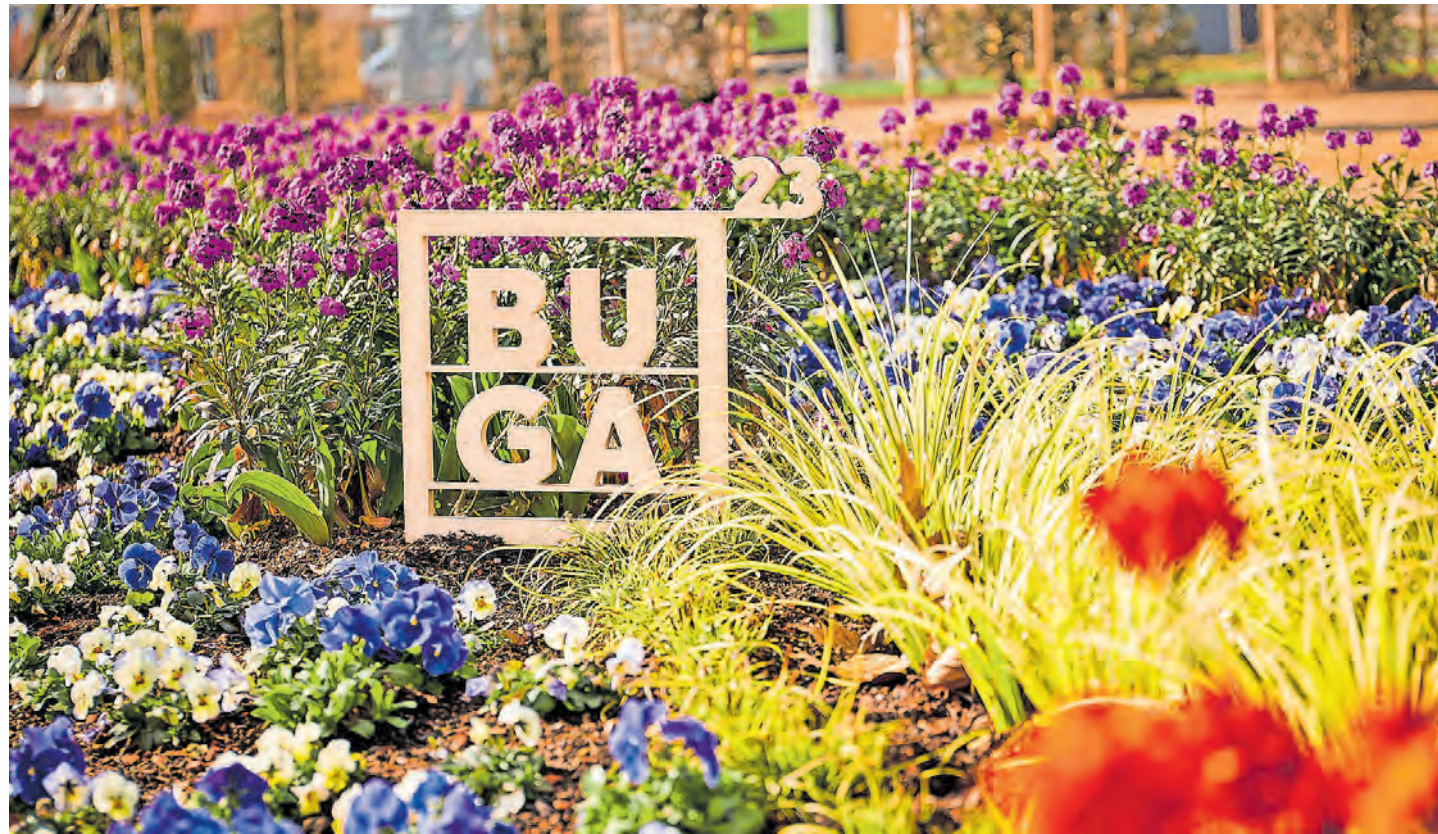
Am Freitag, 14. April, beginnt die BUGA 23 in Mannheim.

Doch zuvor erlebt die Quadratestadt auf insgesamt 104 Hektar, davon 42 Hektar im Luisenpark und 62 Hektar auf Spinelli, eine außergewöhnliche Bundesgartenschau. Es wer-