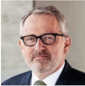
Dr. Peter Kurz Oberbürgermeister

Ratsangelegenheiten Öffentlichkeitsarbeit Wahlen Marketing Strategische Steuerung Organisation, Personal Recht Repräsentation Integrations- und Vielfaltsmanagement Internationales thematische Querschnittszuständigkeiten und Projekte