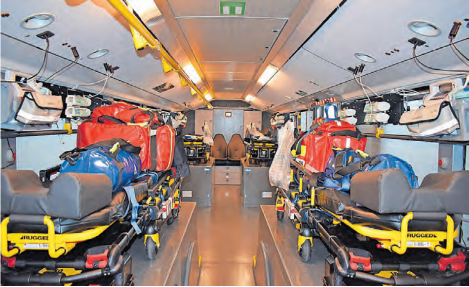
Der Intensivtransportbus von innen

andere als Verzicht bedeutet. Am 10. März gehen die Referentinnen typischen Stammtischparolen auf den Grund. Unter dem Titel „Damit ist nun Schluss: Wir räumen auf mit Klimamythen und falschem Halbwissen“ geht es vor allem um die Frage der Klimagerechtigkeit. Den Abschluss bildet der 24. März, an dem es rund um Photovoltaik-Anlage, Batteriespeicher und E-Ladesäule geht. Anmelde-möglichkeit sowie weitere Informationen sind unter www.abendakademie-mannheim.de/ zu finden.