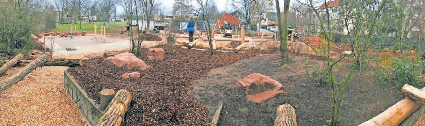
Der Spieplatz in der Rudolf-Maus-Straße nach seiner Sanierung