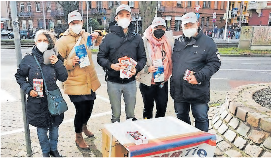
Die Fraktionsmitglieder am 17. Februar vor dem Jobcenter.

Die Mitglieder der Fraktion LI.PAR.Tie. trotzten am 17. Februar dem Sturm und verteilten vor dem Jobcenter am Friedrichsring FFP2-Masken und Flugblätter. Weitere Pakete mit Masken übergaben sie verschiedenen Hilfseinrichtungen. In ihrem Flugblatt wiesen sie darauf hin, dass der Bund und das Land Baden-Württemberg in diesem Punkt unzureichend ihrer Aufgabe der Pandemie-Bekämpfung nachkommen. Denn Menschen mit geringem Einkommen können sich nicht so viele FFP2-Masken leisten, wie das als Schutz gegen das Corona-Virus sinnvoll wäre. Sie bekommen aber trotzdem keine Masken oder Zuschüsse von der öffentlichen Hand. Im Jobcenter Mannheim, das von der Stadt mitbetrieben wird, erhalten sie immerhin eine Maske pro Besuchstermin. Doch das reicht nicht aus. Zumal ja nicht alle Bedürftigen mit dem Jobcenter in Kontakt stehen. Mit der Aktion wollten die Stadträtinnen und Stadträte allerdings nicht nur über Versäumnisse der Politik aufklären, sondern auch praktisch helfen. Denn die Menschen, die auf Leistungen vom Jobcenter oder von sozialen Einrichtungen wie dem Tagestreff