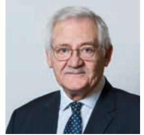
Prof. Dr. Egon Jüttner