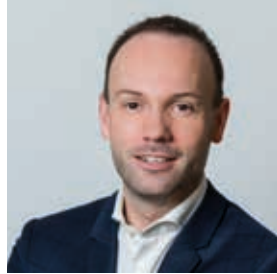
Nikolas Löbel, MdB