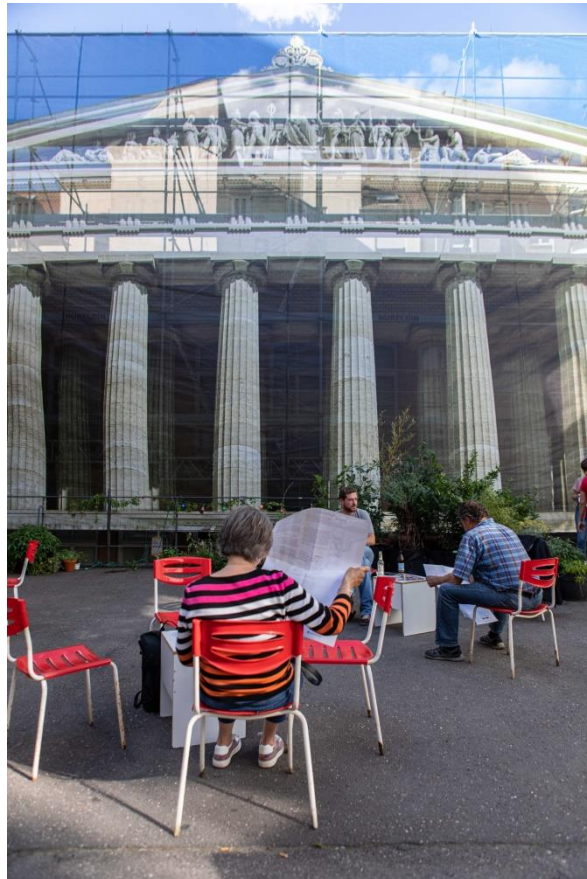
Das Foyer – Das Deutsch, Eine Standortbestimmung, by Christoph Ernst

Friday, November 8. 2019, 18:00 – 22:00 + Saturday. November 9. 2019, 9:00 – 18:00 zeitraumexit / Hafenstraße 68 / Mannheim