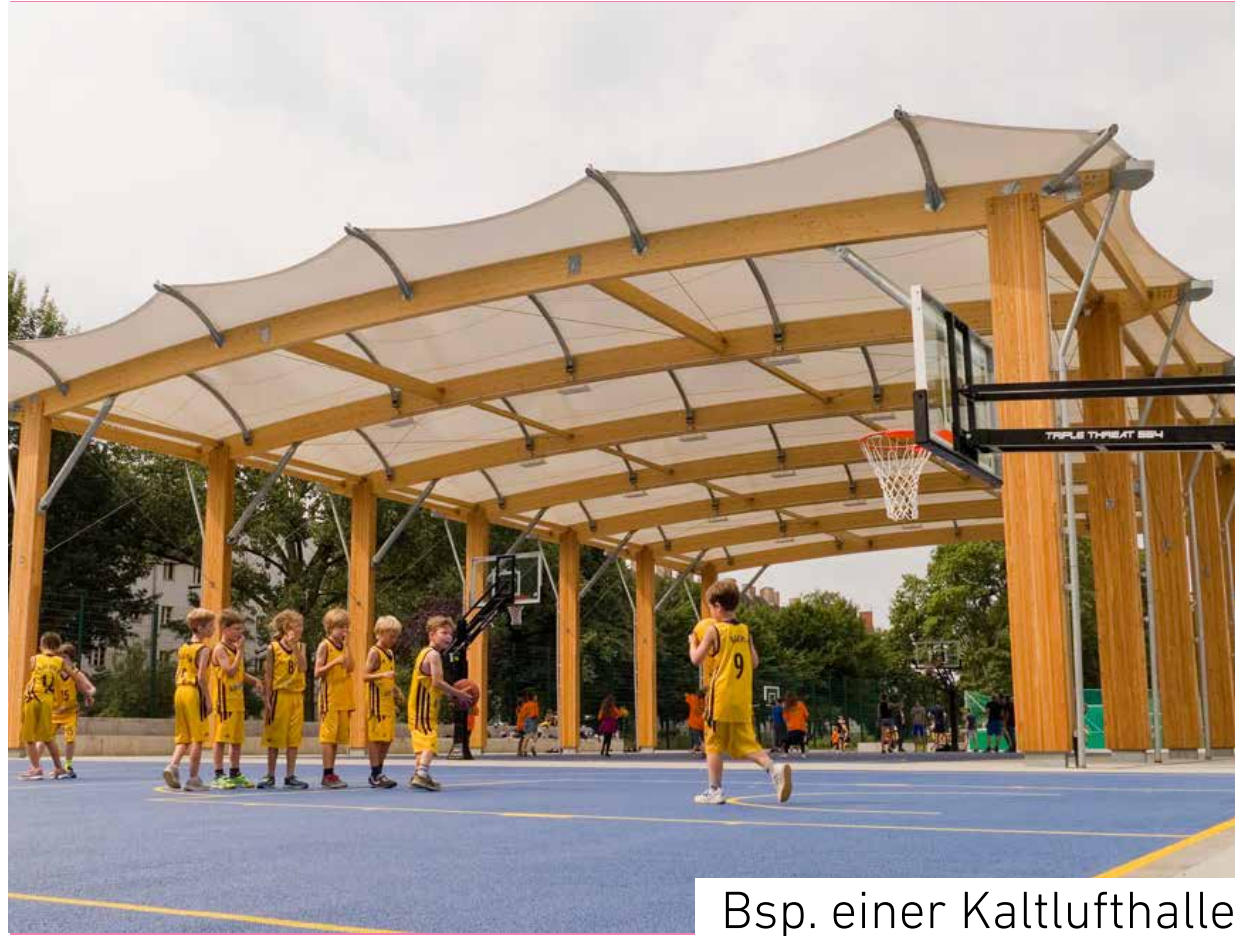
Bsp. einer Kaltlufthalle