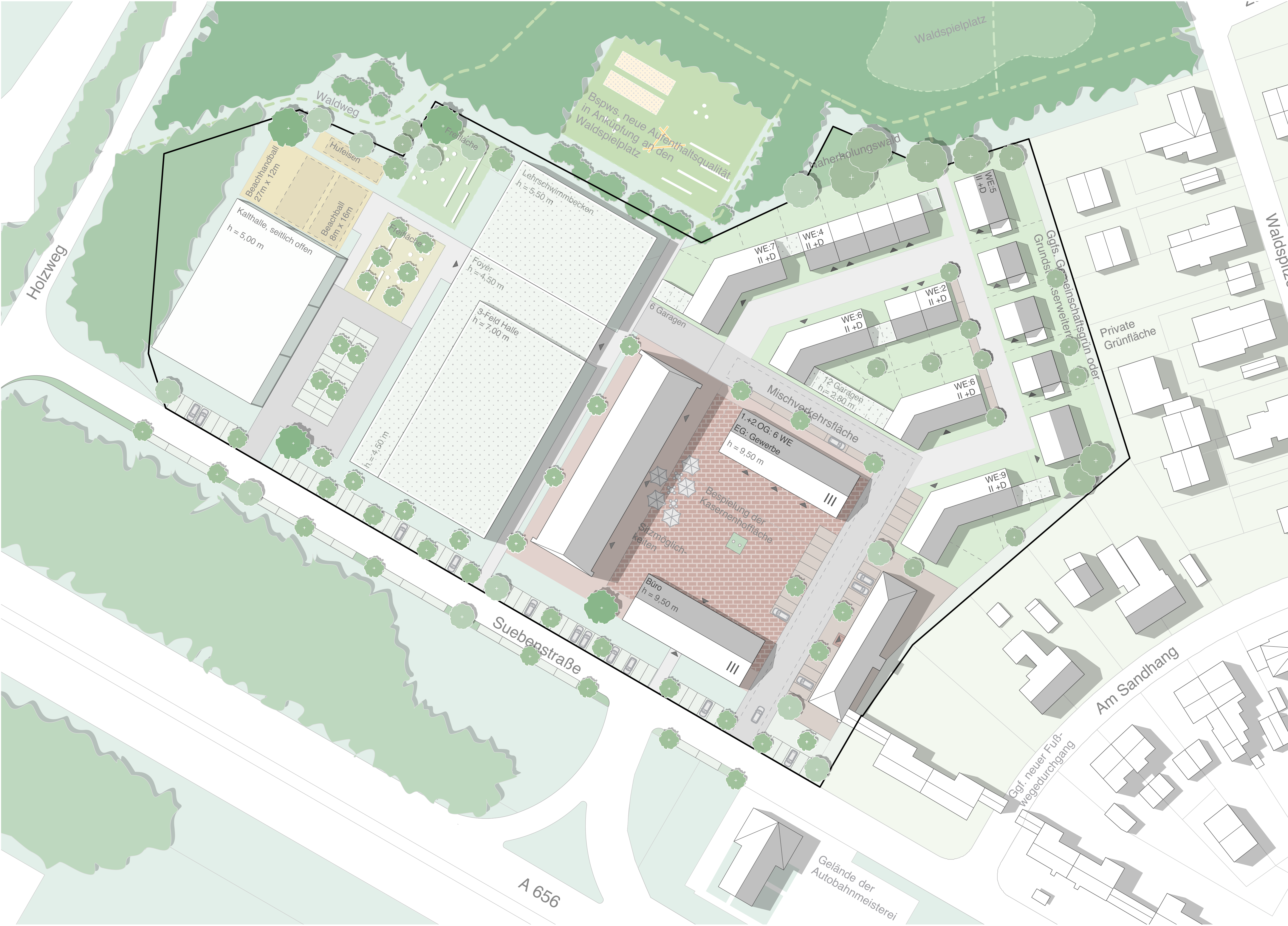
Lageplan Variante 4