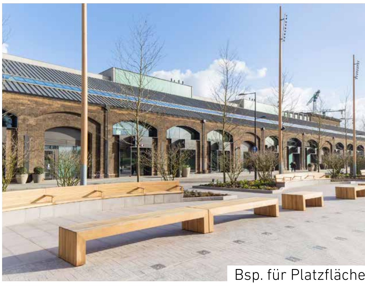
Bsp. für Platzfläche