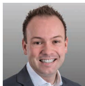
Nikolas Löbel, MdB