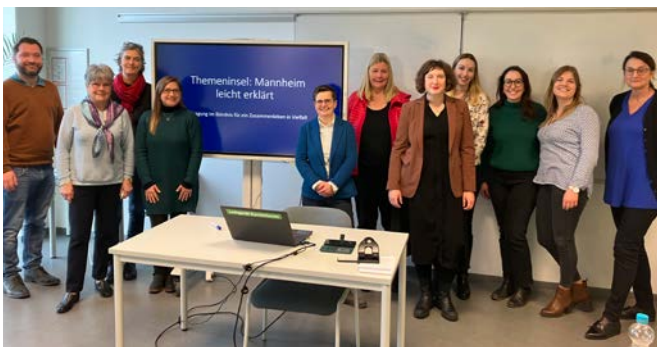
Die Kooperationspartner treffen sich regelmäßig zum Austausch und zum gemeinsamen Erarbeiten von Texten.

Im Rahmen des „Bündnisses für ein Zusammenleben in Vielfalt“ wurde der zweiteilige Workshop „Hinkommen – Reinkommen – Klarkommen: Barrierefreie Veranstaltungen organisieren“ in 2022 wiederholt. Die „einander.Aktionstage 2022“ wurden genutzt, um an vier Stellen das Format „Mannheim Leicht erklärt“ auszuprobieren. Gemeinsam mit dem Queeren Zentrum Mannheim, dem Archivum, dem Kulturparkett und der Stadtbibliothek haben wir diese Orte und deren Aufgaben in Leichter Sprache erklärt. Dies hat uns ermutigt eine Themeninsel „Mannheim Leicht erklärt“ im Rahmen des Bündnisses für ein Zusammenleben in Vielfalt zu initiieren. Die Kooperationspartner (Mannheimer Abendakademie, Stadtbibliothek, Büro für Leichte Sprache der Gemeindediakonie und die Beauftragte) haben ein Konzept erarbeitet, um weitere Bündnispartner*innen zu dem Thema Leichte und Einfache Sprache zu sensibilisieren. Die Resonanz aus Verwaltung und Zivilgesellschaft auf Schulungen und Austauschmöglichkeiten ist groß. Idee ist, dieses Netzwerk auch in 2024 fortzusetzen.