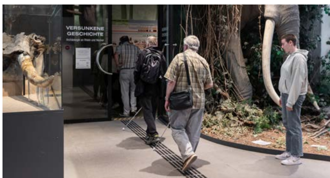
Besuch von BBSV und AG Barrierefreiheit in der neuen inklusiven Ausstellung „Versunkene Geschichte“ im Reiss-Engelhorn-Museum.

Die Arbeitsplatzbeschreibung der Beauftragten für die Belange von Menschen mit Behinderungen (BBMB) umfasst als Kernelement, sich in die größeren Stadtentwicklungsprojekte, in strategische Herausforderungen der Stadtverwaltung und Stadtpolitik, die sich mit Barrierefreiheit und Inklusion befassen, einzubringen.