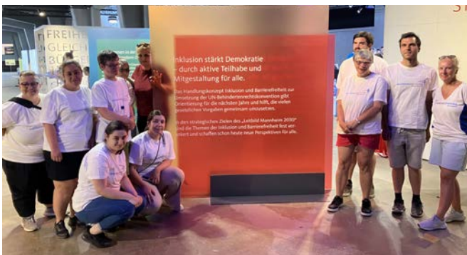
Team der Diakoniewerkstätten Rhein-Neckar

Special Olympics setzen Zeichen für Inklusion Mannheim war im Juli 2022 Austragungsort der Landes-Sommerspiele der Special Olympics Baden-Württemberg. Der ursprüngliche Termin in 2021 musste wegen der Corona-Pandemie verschoben werden, umso bedeutsamer war, dass alle beteiligten Vereine in Mannheim und der Fachbereich Sport und Freizeit dieses große Sportereignis dann in 2022 umsetzen konnten. Vier Tage lang haben rund 700 Teilnehmer*innen sowie Unified Paare in zehn Sportarten ihre