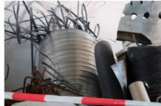
Aus der Konzeptionsphase, Materiallager.