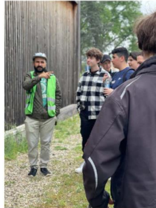
Aus dem Workshopformat